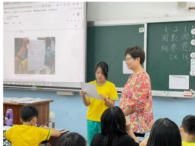
活動：公開授課-學生使用載具做任務